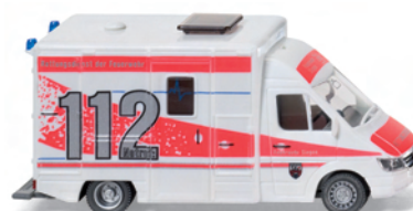
0321 05 31 Rettungswagen – FW Siegen (MB Sprinter)