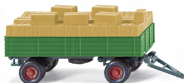
0879 04 23 Landwirtschaftlicher Anhänger