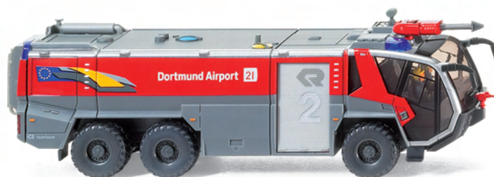
0626 04 46 Feuerwehr Dortmund – FLF Panther 6x6 (Rosenbauer)

Die Mischung macht's – WIKING liefert mit der April-Modellpflege den Beweis dafür, dass der Maßstab 1:87 voller Themenreize steckt! So erfreut die Rückkehr von Opel Admiral und Citroën DS 23 Pallas die Freunde der historischen WIKING-Miniaturen. Beide Modelle entstammen revitalisierten Formen und werden mit hohem Bedruckungskomfort vorbildgerecht veredelt. Ebenfalls zum historischen