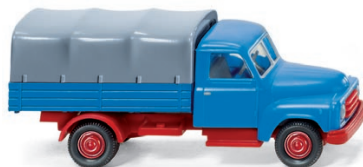
0345 01 Pritschen-LKW (Hanomag Diesel L28) UVP 11,49 €