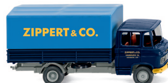
0271 01 Pritschen-Lkw (MB L 408) UVP 13,99 €

Zwei 1:87-Klassiker auf dem Weg zu WIKING-Meilensteinen: Mit dem 64er-Ford Mustang und dem Glas 1700 GT Cabrio erfüllen sich noch vor dem Weihnachtsfest lang gehegte Sammlerwünsche! Außerdem fahren der Borgward B611 mit detailfeinem Interieur als Gefangenentransporter und der Opel Kapitän als Polizeistreife ins Programm. Der THW-Unimog U 1700 sowie der VW Caddy der Berliner Feuerwehr ergänzen die Neuheiten-Auslieferung ebenso wie der MB L 408 der Spedition Zippert und der Schwerlastzug LP 2223 des Kranspezialisten