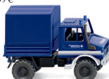
0693 16 THW - Unimog U 1700 mit Plane UVP 9,99 €