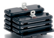
0773 80 Ballastgewichte für Claas Xerion UVP 14,95 €