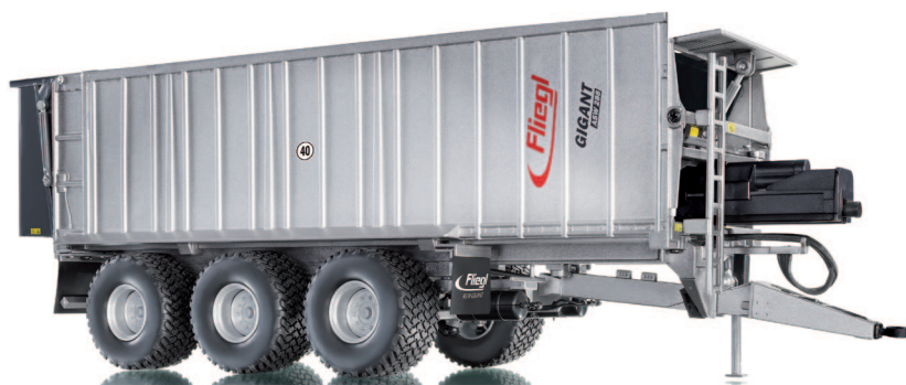
0773 13 Fliegl Abschiebewagen ASW288 UVP 59,95 €