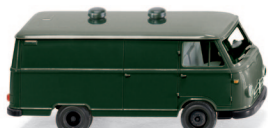
0270 48 Borgward Kastenwagen B611 UVP 12,49 €