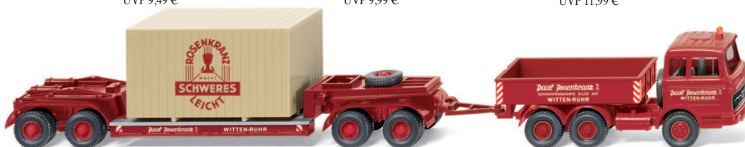
0504 01 Schwerlastzug (MB LP 2223) UVP 24,99 €