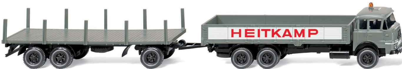
0502 01 Schwerlasthängerzug (Krupp) UVP 18,99 €

Im Nu war der VW Amarok bei seiner Modellpremiere vergriffen, rechtzeitig zum Winter stellt WIKING die filigrane Miniatur nach dem topaktuellen Pick-up-Vorbild aus Hannoveraner VW-Produktion in leicht modifizierter Modellpflege vor. Auch der VW T5 GP als Zustellfahrzeug der Deutschen Post repräsentiert die neueste Typengeneration des erfolgreichen Transporters in 87-facher Miniaturisierung. Mit dem Magirus