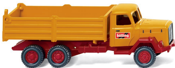
0424 02 Hochbordkipper (Magirus Saturn) UVP 12,99 €