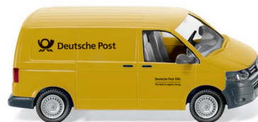
0309 06 VW T5 GP Kastenwagen UVP 14,49 €