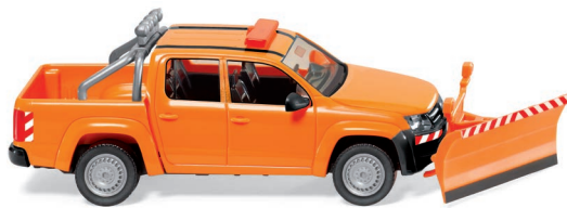
0311 07 VW Amarok - Winterdienst UVP 19,99 €