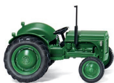
0892 04 Ferguson TE UVP 9,49 €