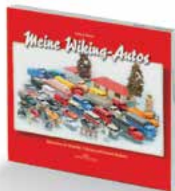
0006 44 WIKING-Buch „Meine Wiking-Autos“ Preis 29,90 €

K lassiker der 1950er- bis 1980er-Jahre machen den WIKING-Jahresstart 2014 perfekt: Erstmals setzt sich der Büssing 8000 mit Hinterkipper-Auflieger als Baustellenfahrzeug in Szene. Als Kommunalfahrzeug mit Hebebühne fährt der Magirus-Frontlenker vor, während der Mercedes-Benz L 1413 zum Spezialeinsatz beim THW ausrückt. Noch in den 1970er-Jahren sind die Vorbilder der legendären MAN-Pausbacke als Abschleppwagen und sein Typennachfolger MAN 19.230 als Schwertransport der Spedition Siefert unterwegs. Genau dazu passt der