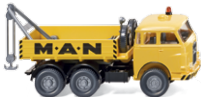
0634 01 Abschleppwagen (MAN Pausbacke) UVP 14,99 €