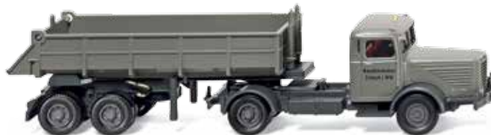
0677 01 Hinterkipper (Büssing 8000) UVP 16,99 €