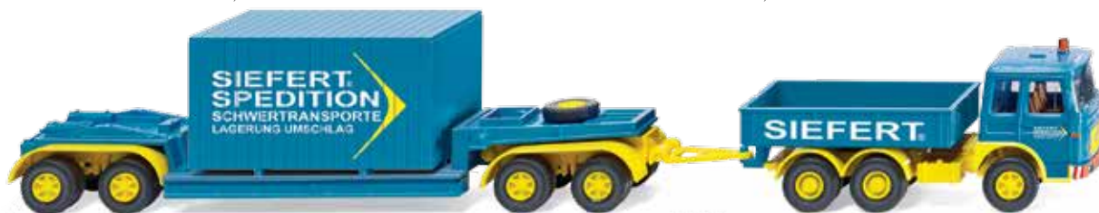
0504 02 Schwerlastzug (MAN 19.230) UVP 26,99 €

K lassiker der 1950er- bis 1980er-Jahre machen den WIKING-Jahresstart 2014 perfekt: Erstmals setzt sich der Büssing 8000 mit Hinterkipper-Auflieger als Baustellenfahrzeug in Szene. Als Kommunalfahrzeug mit Hebebühne fährt der Magirus-Frontlenker vor, während der Mercedes-Benz L 1413 zum Spezialeinsatz beim THW ausrückt. Noch in den 1970er-Jahren sind die Vorbilder der legendären MAN-Pausbacke als Abschleppwagen und sein Typennachfolger MAN 19.230 als Schwertransport der Spedition Siefert unterwegs. Genau dazu passt der