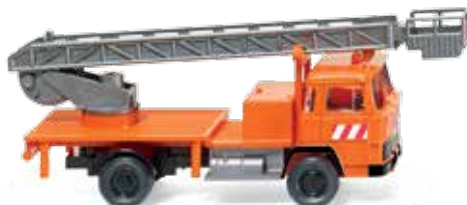
0644 01 Hebebühnenwagen (Magirus) UVP 13,99 €