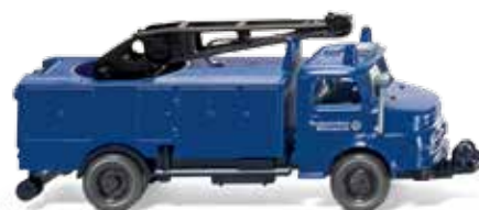
0693 21 THW - Rüstwagen (MB L 1413) UVP 13,49 €