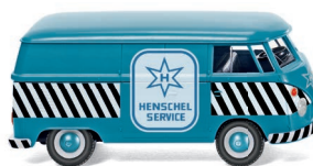
0797 16 VW T1 Kastenwagen UVP 14,49 €