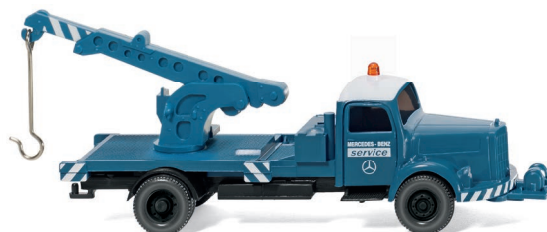
0421 01 Autokran (MB L 3500) UVP 13,49 €