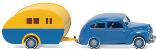
0820 04 Ford Taunus G73A mit Reiseanhänger UVP 18,49 €