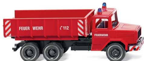
0624 02 Feuerwehr - Schuttwagen (Magirus Deutz) UVP 13,49 €