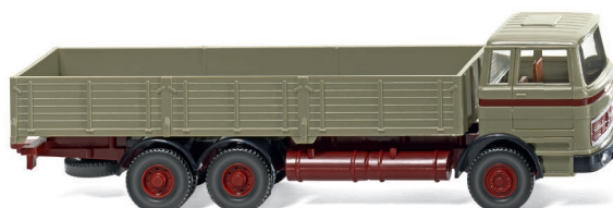
0433 03 Hochbordpritschen-Lkw (MB) UVP 13,99 €

In 1:87 gibt es ein Wiedersehen mit wunderschönen Klassikern wie dem legendären Mercedes-Benz C 111, aber auch dem Mercedes-Benz L 3500 als Service-Kranwagen. In den einstigen Farben des Henschel-Kundendienstes erscheint der VW T1. Der Mercedes-Benz mit kubischem Fahrerhaus und Hochbordpritsche ergänzt die zeitgenössischen WIKING-Miniaturen genauso wie der Ford