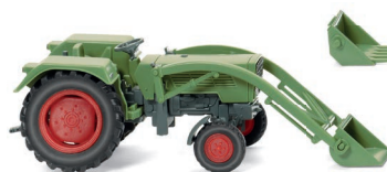
0890 03 Fendt Farmer 2S mit Frontlader UVP 12,49 €