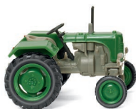
0876 48 Steyr 80 UVP 9,99 €