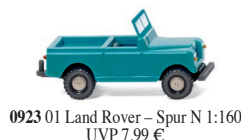
0923 01 Land Rover – Spur N 1:160 UVP 7,99 €

W IKING macht in der maßstabsgetreuen 1:87-Containerwelt mobil und lässt damit lang gehegte Sammlerwünsche Wirklichkeit werden. Den Anfang machen ein Scania-Containersattelzug sowie ein passendes Zubehör-Set für den Containerwechsel. Die Traditionsmodellbauer, die bereits vor mehr als 50 Jahren mit der Miniaturisierung der Logistikboxen begonnen haben, bedienen sich für die Modell-Neuheiten der topaktuellen Vorbilder von Fahrgestell und Containern – eine exakte Filigranbedruckung gehört ebenso dazu. Zu den weiteren Neuheiten