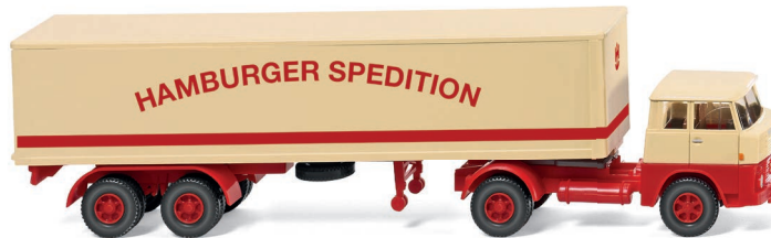
0513 19 Koffersattelzug (Henschel HS 14/16) UVP 19,99 €