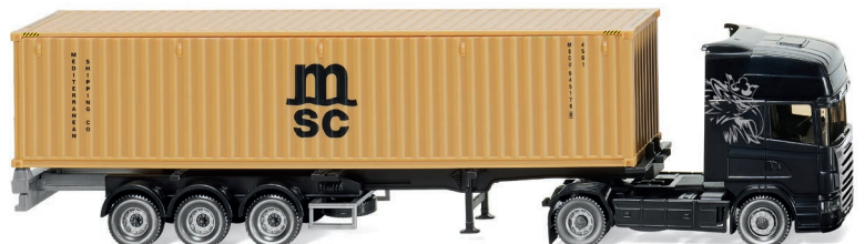
0523 49 Containersattelzug (NG) (Scania) UVP 31,99 €