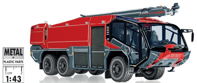
0430 49 Feuerwehr – Rosenbauer FLF Panther 6x6 UVP 79,95 €