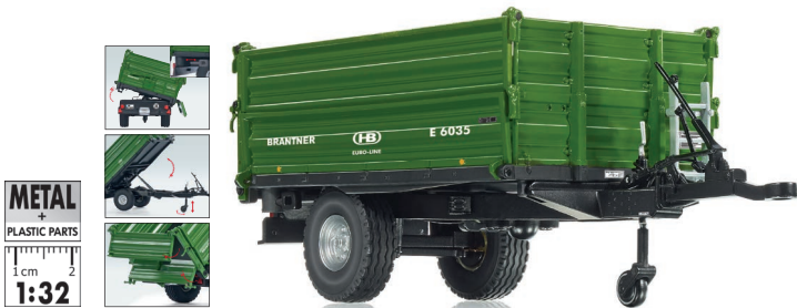
0773 48 Brantner E 6035 Einachs-Dreiseitenkipper UVP 59,95 €