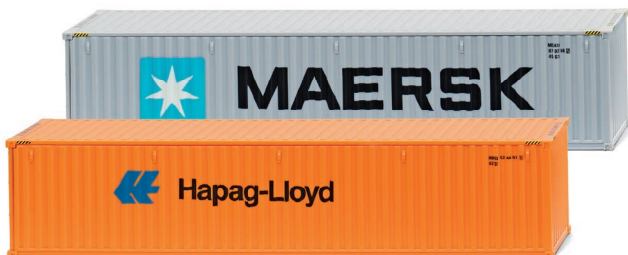
0018 13 Zubehörpackung – 40' Container (NG) UVP 15,99 €