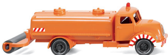
0640 01 Kommunal – Sprengwagen (Magirus Sirius) UVP 13,99 €