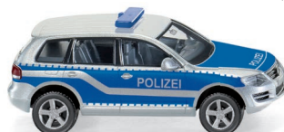
0104 49 Polizei – VW Touareg GP UVP 16,99 €