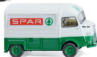
0262 04 Citroën HY Verkaufswagen UVP 11,99 €