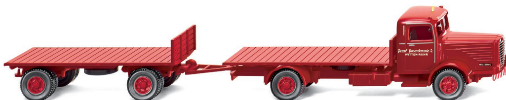
0856 01 Flachpritschenlastzug (Büssing 8000) UVP 17,99 €