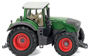
0361 60 Fendt 1050 Vario UVP 16,99 €