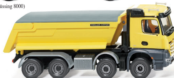
0674 49 Muldenkipper (Meiller/MB Arocs) UVP 32,99 €