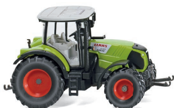
0363 10 Claas Arion 640 UVP 14,99 €