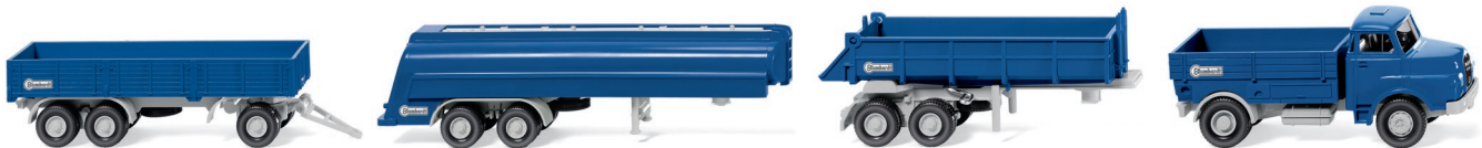
Bestandteile Set "Blumhardt"