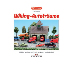
0006 45 Buch "Wiking-Autoträume" 34,90 €