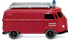
0861 41 Feuerwehr – VW T1 Kastenwagen UVP 10,99 €