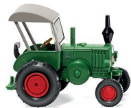
0880 08 Lanz Bulldog mit Dach UVP 9,99 €