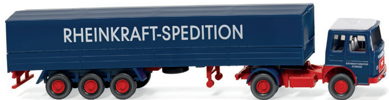
0517 01 Pritschensattelzug (MAN) UVP 21,49 €