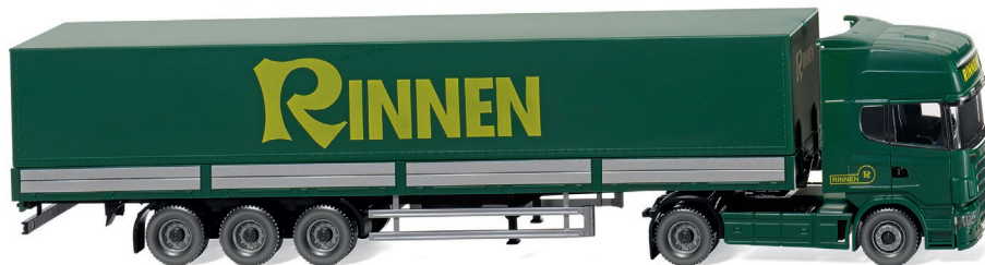
0518 04 Pritschensattelzug (Scania R 420 Topline) UVP 28,99 €